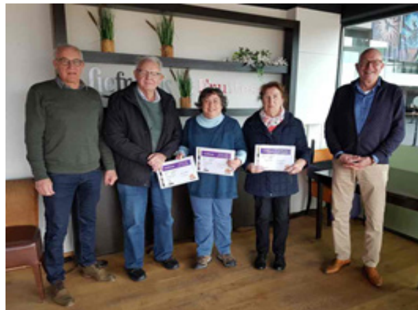
Geslaagde deelnemers DigiD, wat doe je ermee?

De gratis toegankelijke cursussen Klik&Tik en 'DigiD, wat doe je ermee?' en het gratis belastingspreekuur werden op grote schaal bezocht door mensen die weinig digitale vaardigheden hebben maar die wel zelfstandig overheidszaken willen regelen.